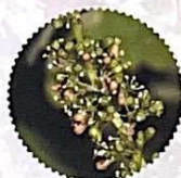
chute des capuchons / nouaison