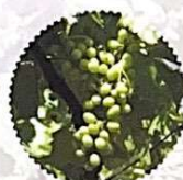
avant fermeture grappe