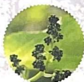
boutons floraux séparés